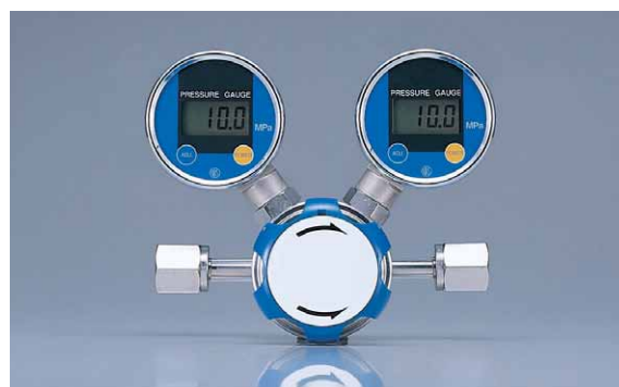
4ポートの圧力調整弁への取付例

4ポートの減圧弁に取り付ける場合、デジタル表示が水平になるように、表示角度左右30°傾けることができます。(写真参照)